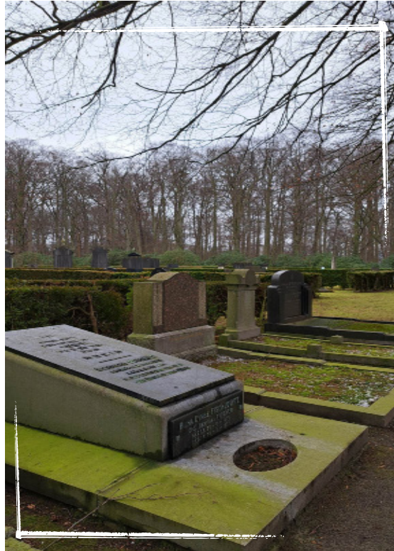
Friedhof Schoonselhof, Antwerpen.

Wenn eine jüdische Person stirbt, ist es unerlässlich, dass der Leichnam zu jeder Zeit mit äußerster Sorgfalt und Respekt behandelt wird. Es gibt besondere Regeln für die Vorbereitung des Körpers für die Beerdigung, und der Körper darf nie unbeaufsichtigt bleiben. Autopsien sind nach jüdischem Recht nicht erlaubt, es sei denn, sie sind gesetzlich vorgeschrieben. Die Einäscherung wird von einigen jüdischen Menschen praktiziert, ist aber in jüdisch orthodoxen Gemeinden strengstens verboten. Nach der Beerdigung trauert die direkte Familie des Verstorbenen sieben Tage lang zu Hause. Dies ist die Zeit von Shiv'a.