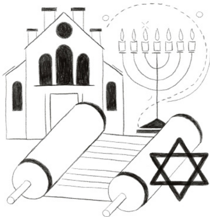
Synagoge, Menora, Sefer Thora, Ster van David.