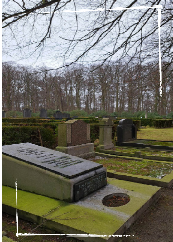
Begraafplaats in Schoonselhof, Antwerpen.

Wanneer een jood overlijdt, is het van essentieel belang dat het lichaam te allen tijde met uiterste zorg en respect wordt behandeld. Er zijn speciale regels voor het voorbereiden van het lichaam op de begrafenis en het lichaam mag nooit onbeheerd worden achtergelaten. Autopsies zijn volgens de Joodse wet niet toegestaan, behalve waar dit wettelijk vereist is. Crematie wordt door sommige Joodse mensen uitgevoerd, maar is ten strengste verboden in orthodox-Joodse gemeenschappen. Na de begrafenis rouwt de directe familie van de overledene zeven dagen thuis. Dit is de periode van sjiivve.