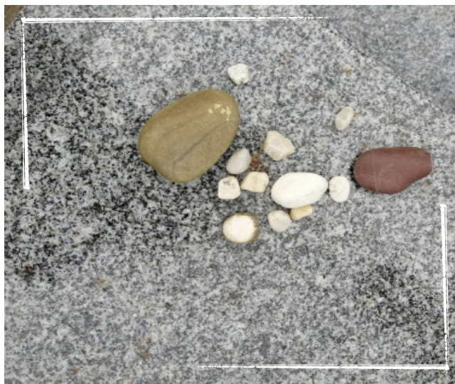
Joods graf met kleine stenen.

Wanneer een jood overlijdt, is het van essentieel belang dat het lichaam te allen tijde met uiterste zorg en respect wordt behandeld. Er zijn speciale regels voor het voorbereiden van het lichaam op de begrafenis en het lichaam mag nooit onbeheerd worden achtergelaten. Autopsies zijn volgens de Joodse wet niet toegestaan, behalve waar dit wettelijk vereist is. Crematie wordt door sommige Joodse mensen uitgevoerd, maar is ten strengste verboden in orthodox-Joodse gemeenschappen. Na de begrafenis rouwt de directe familie van de overledene zeven dagen thuis. Dit is de periode van sjiivve.