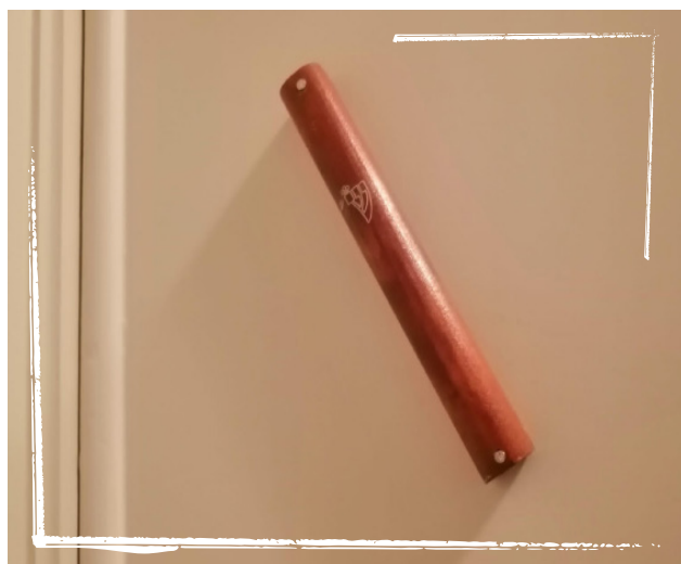
Mezoeza, woning in Brussel.

De mezoeza die boven de voordeur is geplaatst, maakt het pand herkenbaar als een Joodse woning. Als gevolg hiervan kunnen het gebouw of appartement, evenals degenen die erin wonen, worden blootgesteld aan antisemitische aanvallen, zoals graffiti en vandalisme, of zelfs een fysieke aanval in de buurt. Het is wenselijk om het slachtoffer/de slachtoffers van dergelijke aanvallen te vragen of er zichtbare religieuze symbolen waren die de aanvaller zouden kunnen doen geloven dat de slachtoffers Joods waren.