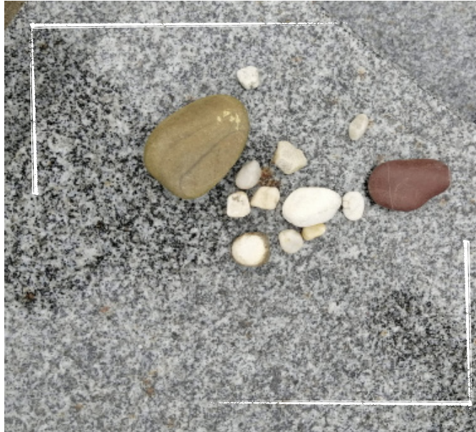
Joods graf met kleine stenen.

Na de begrafenis rouwt de directe familie van de overledene zeven dagen thuis. Dit is de periode van sjivve.