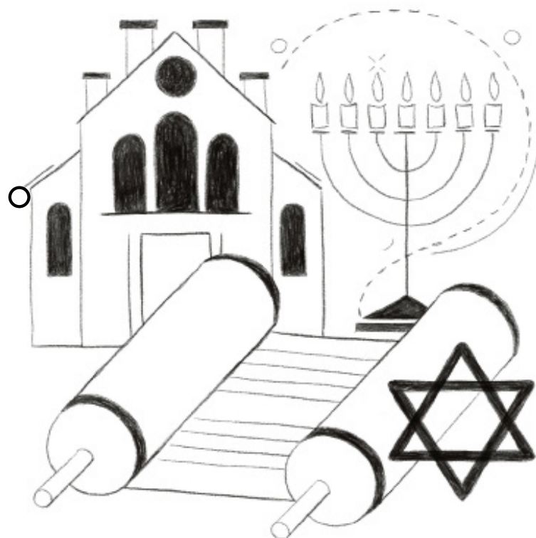
Synagoge, Menora, Sefer Thora, Ster van David.