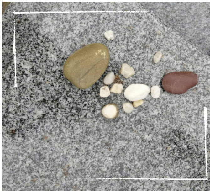
Tombe juive avec des petites pierres.

Après les funérailles, la famille directe du défunt fait son deuil à la maison pendant sept jours. C'est la période de Shiv'ah.